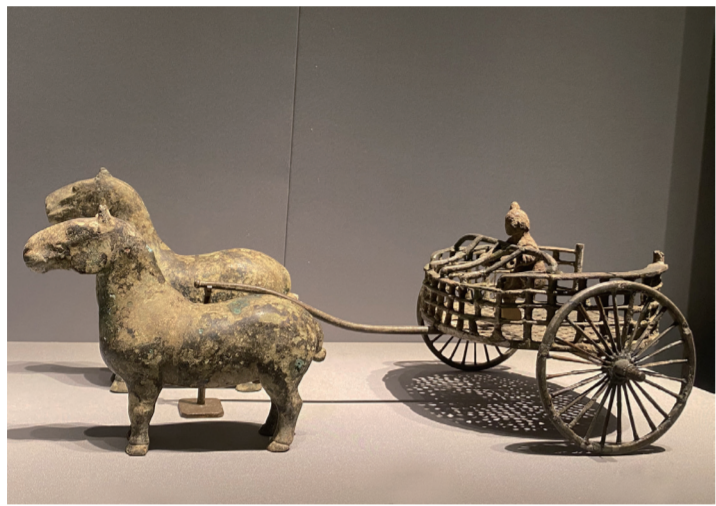
图：陕西历史博物馆展出的铜车马

之后，我逐渐发现，在小红书上，当下不少传统博物馆和当代艺术馆都与网红打卡点并列，被人整理在“拍照攻略”的系列内。我也慢慢地开始接受，这也许就是社会娱乐化、多元化趋势带来的必然结果，如果博物馆要真正成为大众文化，就不能老是“端着”。大家本着打卡的心态去逛博物馆，把参观博物馆当作旅游景点、印证一些书上和影视中看到的历史，那么，它本身也是在起到传播文化的作用。