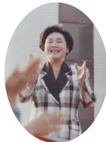
▲ 1992年，李谷一来红豆集团演出

回顾李谷一的艺术生涯，其实就是一部探索传统文化艺术的传承与创新史。从艺58年，演唱歌曲近800首，李谷一始终将自己的艺术实践与改革开放进程紧紧相连，用歌声见证改革开放的豪迈壮举，用作品抒发祖国的豪情、人民的心声。