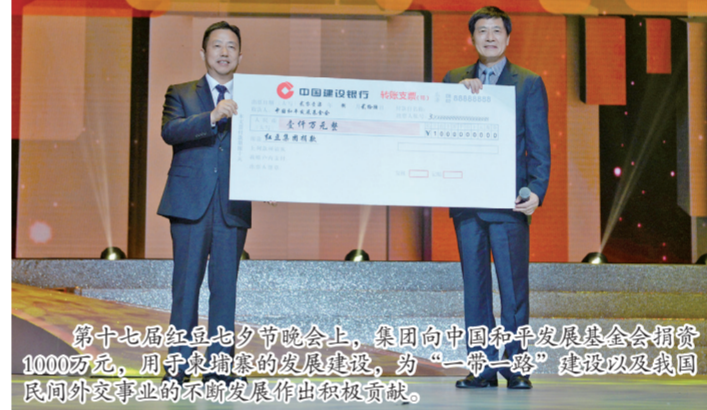
第十七届红豆七夕节晚会上，集团向中国和平发展基金会捐赠1000万元，用于柬埔寨的发展建设，为“一带一路”建设以及我国民间外交事业的不断发展作出积极贡献。

欣赏到经典舞剧双人舞片段《南国红豆》、音诗画节目《红豆七夕节，中国情人节》、聆听男女通俗二重唱《红豆恋歌》等。著名歌星江涛、著名女高音歌唱家陈明华等的倾情加盟，将会使晚会更有吸引力。值得关注的是，围绕“爱在七夕、红豆传情”的主题，红豆集团还积极与湖北有关部门进行深入沟通。在晚会现场不仅会把红豆集团旗下各品类产品以超值优惠向广大红粉进行推介，还将以视频的形式向大家展示湖北省知名特色产品，力求将“以情带货”的理念落到实处，助力湖北相关产业发展，实现互利共赢。直播的平台有腾讯视频、中国经济网、新浪、网易、扬子晚报、ZAKER等，全国各地的红粉们通过一台小小的手机就可以一边看精彩的节目，一边购买自己心仪的产品来过七夕。