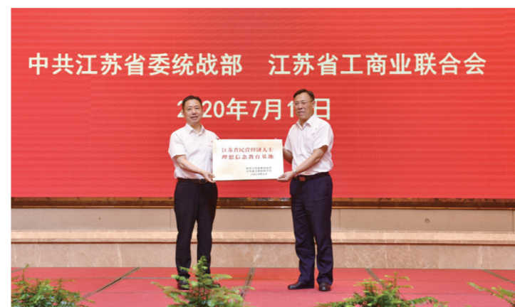
中共江苏省委统战部 江苏省工商业联合会 2020年7月14日 理想信念教育基地授牌仪式

据了解，2019年6月，在全国工商联举办的民营企业党建工作现场会上，红豆集团获全国工商联“全国非公有制经济人士理想信念教育基地”授牌，成为首批教育基地中唯一一家民营企业。2019年8月，江苏省委组织部“江苏省党支部书记学院民企分院（无锡）”在红豆集团挂牌，系江苏省唯一一家。在六十多年的发展历程中，红豆集团始终坚持以党建引领企业治理，始终坚持“听党话、跟党走，讲正气、走正道”，形成了“一核三优”“一融合双培养三引领”“五个双向”等党建经验、工作方法和工作机制，倡导并践行“八方共赢”社会责任理念，探索构建“现代企业制度+企业党建+社会责任”三位一体的企业治理模式，有效保证了企业健康发展和企业人士健康成长。2011年，中组部授予红豆集团党委“全国先进基层党组织”称号。2015年，“红豆工作法”专题片被中组部列为全国基层服务型党组织4个全国工作法之一向全国推广。2019年7月，红豆集团的党建经验入选中组部组织编选的《不忘初心、牢记使命》主题教育学习丛书案例之《党的建设》本。红豆集团党委不断扩大党建示范效应，积极热情做好各地党员干部前来学习交流的接待工作，年均接待3万多人次。