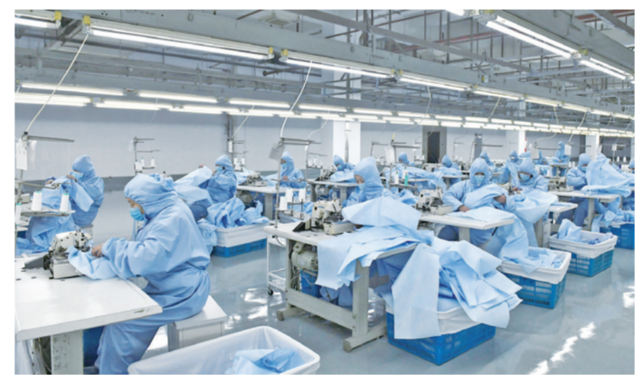
红豆集团各公司实现安全有序复工复产。

资紧缺状况，红豆集团就将服装生产线转变为防疫工作需要的防护服生产线，开足马力生产。2月10日起，红豆集团各公司实现安全有序复工复产。2月9日，集团达到日产一般防护服3万件。2月11日，首批10万只日常防护型口罩顺利下线，日产能达10万只，设备逐步到位后，日产量达500万只。同时，医用一次性防护服生产车间已完成改造，即将进入生产，日产量达6万套。