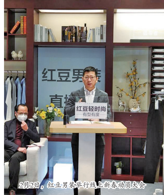
2月2日，红豆男装举行线上新春动员大会