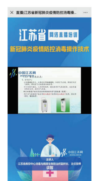
江苏省网络直播培训。

豆居家开展《文胸节如何增量用户》线上培训，高级运营经理举例说明业绩增长与增量用户之间的关系，并从线上线下2个途径讲解了开发增量用户的具体方法以及维护朋友圈的注意事项，参与人次达3384。